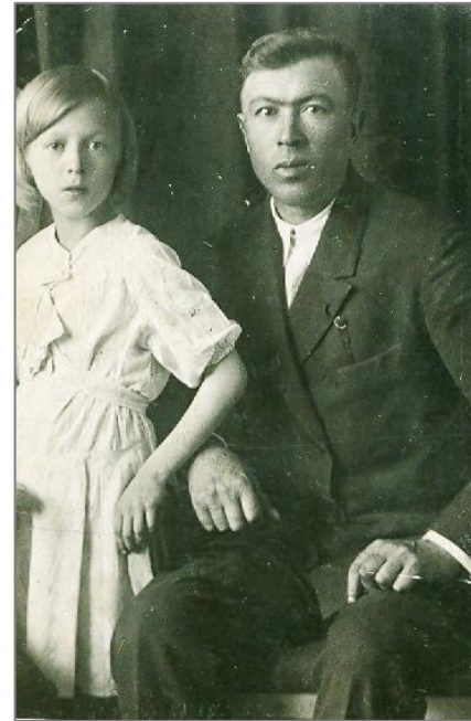
Я с отцом. 1940 год

Была квартира, хоть и небольшая, у родителей работа, но отцу вряд ли нравилась городская жизнь. Несмотря на свой сдержанный характер, он, видимо, в кругу знакомых высказывал своё мнение,